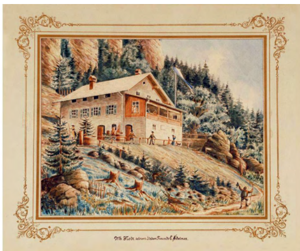
Das Brünsteinhaus 1894 nach einer Zeichnung des Rosenheimer Malers Michael Kotz

Drum sag ich ja, es gibt nur oan Berg auf der Welt Inns Inntal hat ihn die Natur so prächtig gestellt Dort winkt er uns allen zu: Kommt rauf zur Alpenruh Rastet alle von den Sorgen aus: Im Brünsteinhaus.