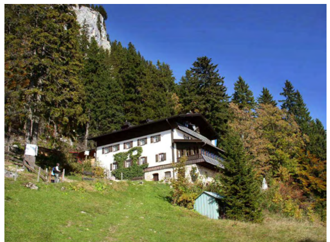
Das Brünsteinhaus heute